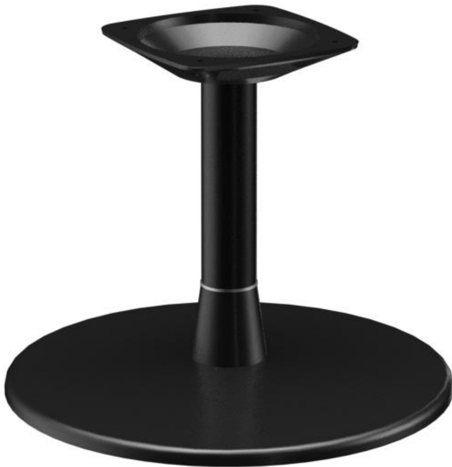
TABLE BASSE MODULAR T